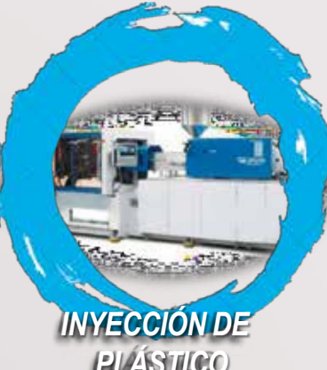
INYECCIÓN DE PLÁSTICO