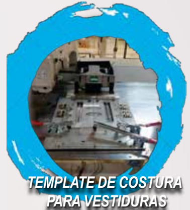
TEMPLATE DE COSTURA PARA VESTIDURAS